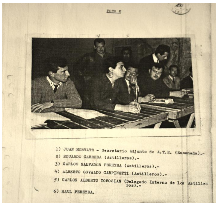
Registro de la DIPPBA sobre referentes gremiales de Astilleros Río Santiago.